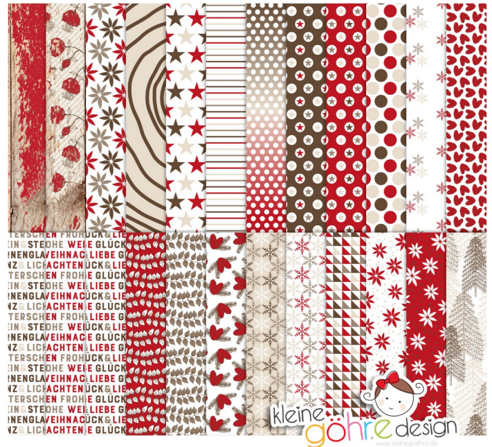
digitale Papiere "Es weihnachtet Muster 2"