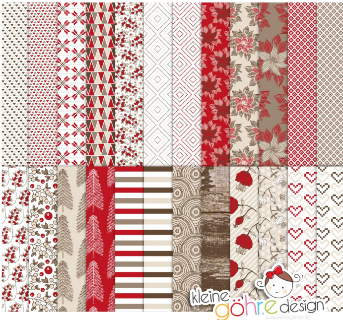
digitale Papiere "Es weihnachtet Muster 1"