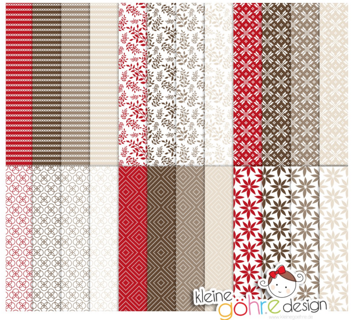
digitale Papiere "Es weihnachtet Basic 2"